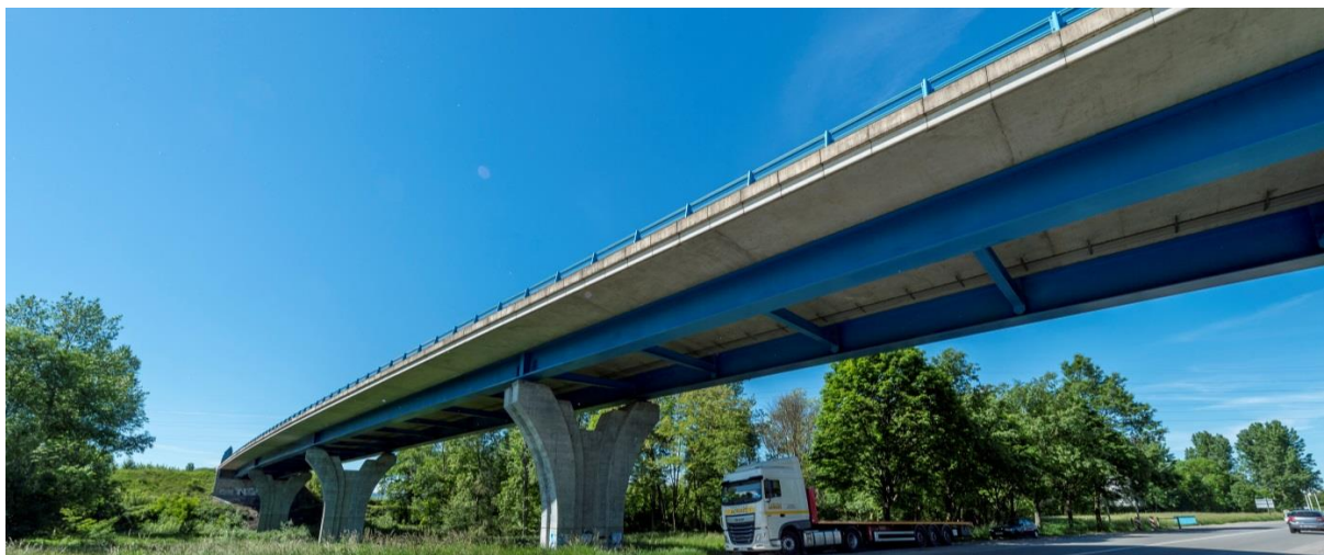
Ci-dessus viaduc de Varennes

Un des temps forts de ce chantier consiste au doublement du viaduc de Varennes. Les premières opérations de forage de ce futur ouvrage viennent de démarrer.